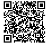
予約システム QRコード

https://yoyaku-kounosu-saitama.jp/kounosu